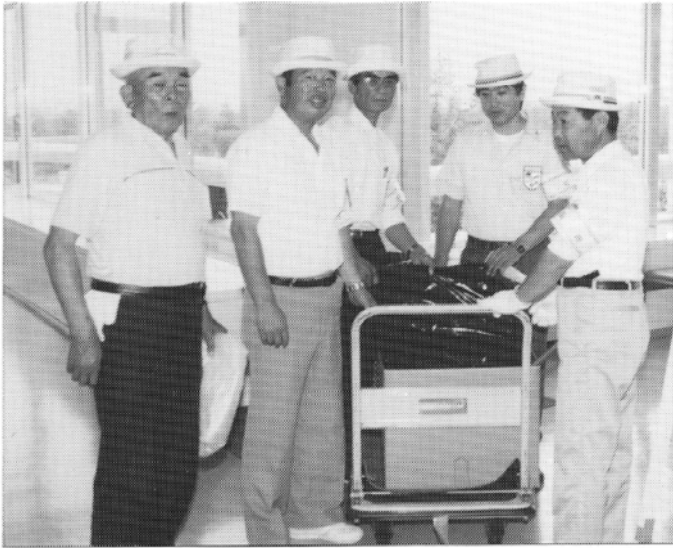
いつもきれいで気持ちよく