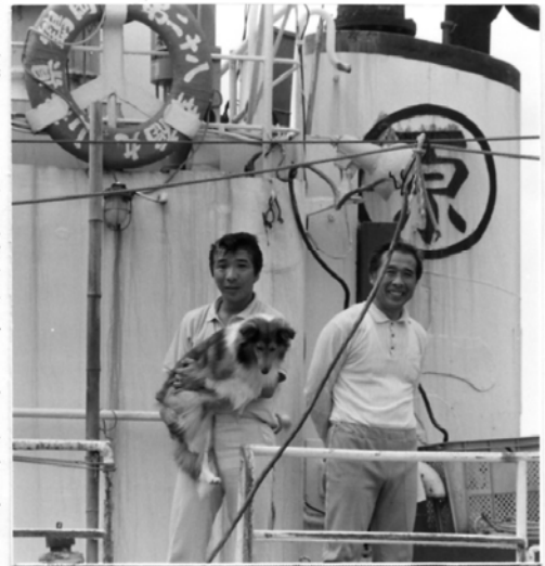
△「漁から帰ってのひととき」

うっとうしい連日の雨。7月二十一日、作物の日照不足が心配されるそんな気候のなか、写真部の移動撮影会が行われた。朝七時、早い時間にもかかわらず各部署の生きた目と目。今回の主なメニューは水着撮影会だから？二台の車に分乗し、目的地の由良海岸へ。車中では「初めてだからどう撮ったらいんだベエー」とか、「フレーミングはどうすつべー」と話しながらも、各自の思いは青い海と、白い波しぶきの砂浜が臉に浮かんでいたに違いない。