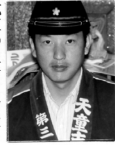
今年度、北消防団の部長になり