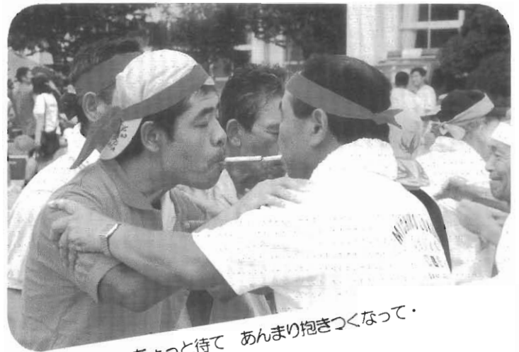
ちょっと待て あんまり抱きつくなって・