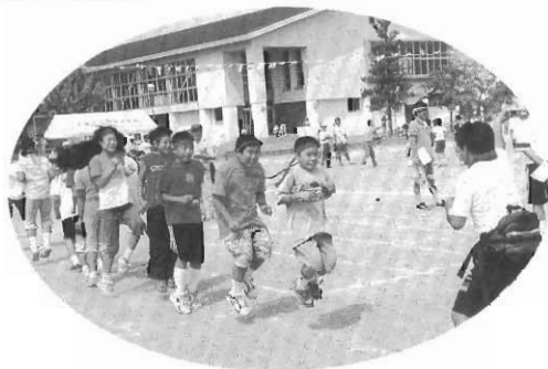
ワンツ〜じゃないぞ・い〜ち に〜い だゾ