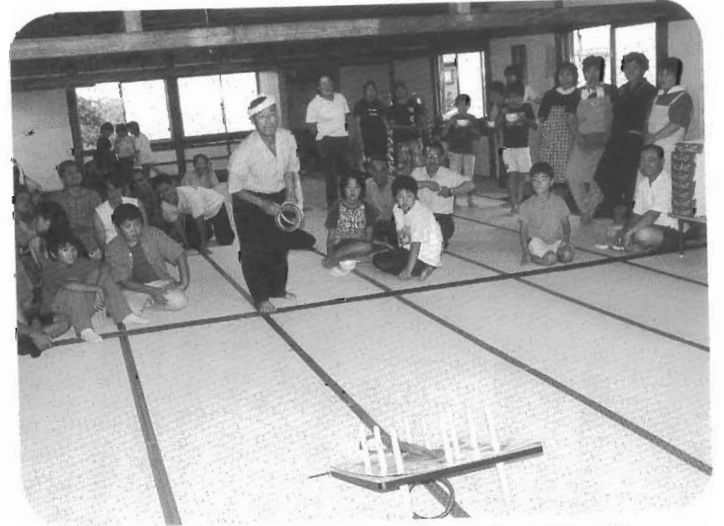
いよっ、命中 (夏まつり：雨のため屋内でゲーム)