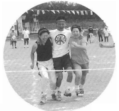
やった1位だ! 夜の公園で練習したもんね