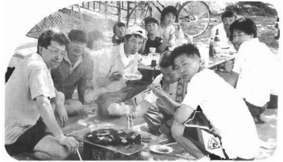
心地良い汗を流した後、いつの間にか消防団と合コン

試合後、北堀公園でビールと焼肉で反省会を行いました。たまたま消防団も集まっていた、いつの間にか合同の懇親会に変わり、若い人が入り混じって、時間を忘れて大いに盛り