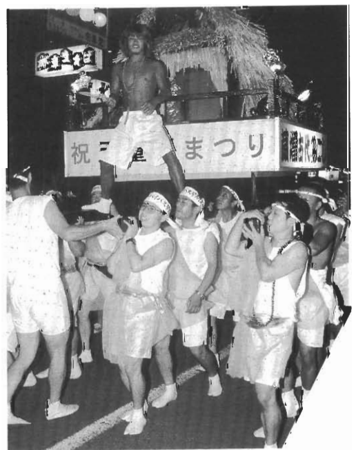
想いは古代に馳せ、「西沼田」を担ぐ

八月九日、天童夏祭りのメイン行事「神輿」を撮影することに。この祭りで蔵増地区の有志が、「西沼田遺跡」をモチーフにした創作「古代みこし」を市中堂々と演じるのここと。