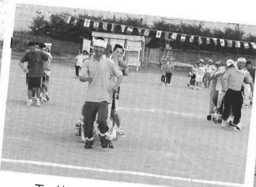
エッサ ホイサ 速いぞ つばさ号