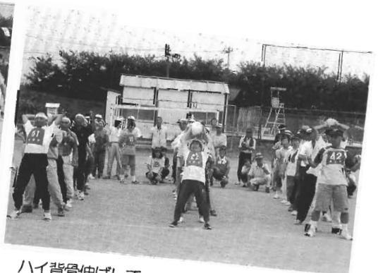
ハイ背骨伸ばして～ ミミミミ