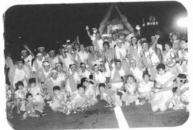
北区のみなさんも爆発気分 (真夏の夜の天童みこしパレード)