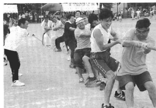
二年連続決勝進出 来年は窪野目破るぞ〜