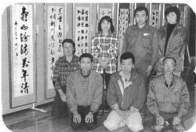
北区の総会にも展示します。ご覧あれ

多数の部員が出品しました。十一月三日、四日と展示し、鑑賞する方々から大変好評で、年々出品を重ねる毎に各部員の上達振りに驚かされます。少ない練習時間内で一生懸命書き上げてきた熱意が伝わってきて、当書道部のレベルの高さを感じ取られました。