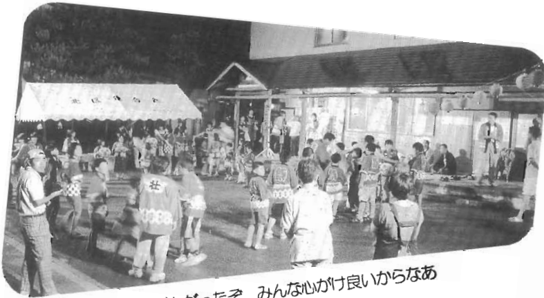
雨が上がったぞ みんな心かけ良いからなあ