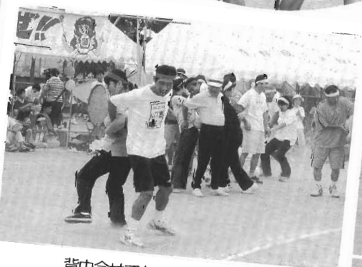
背中合せでも 気持ちはひとつ