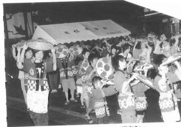
狭いながらも ヤッショー・マカジョ・