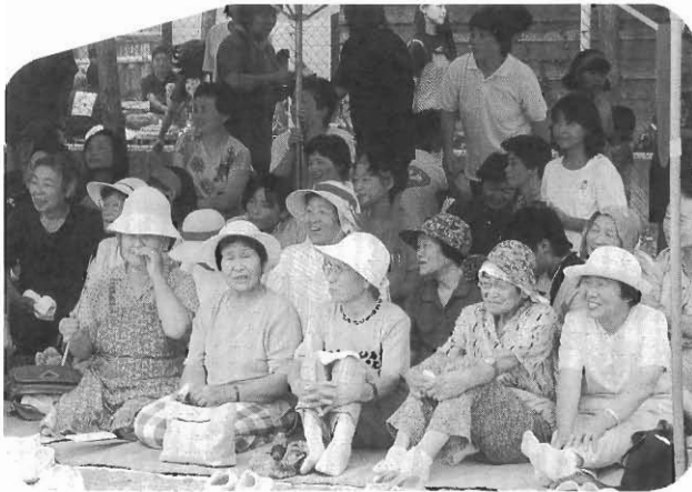
笑顔で明るく、元気の出る「地域づくり」に参加しよう

地域に住んでいても、ふれ合いも交流もないなんて味気のないものです。色々な職種の人があります。親